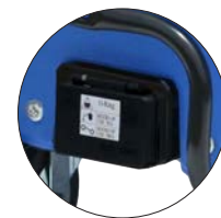
Mod. 6 bar