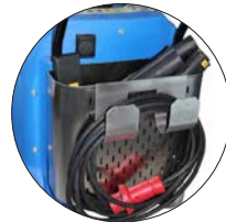
Accessories basket & cable holder